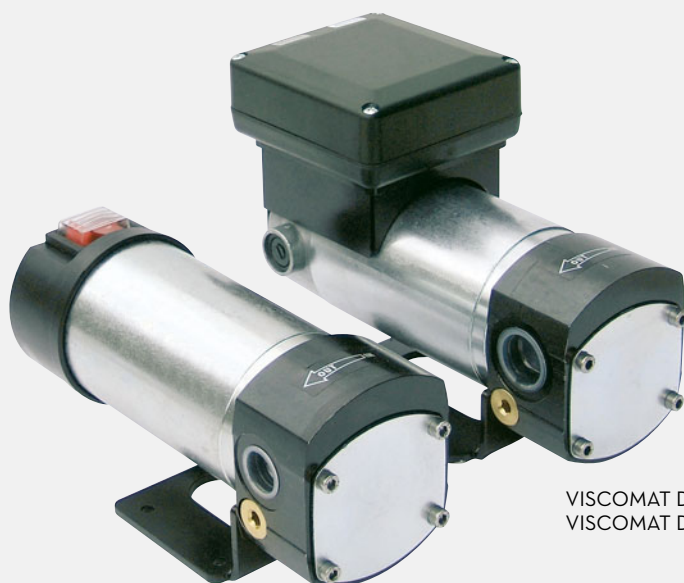
VISCOMAT DC 60/1